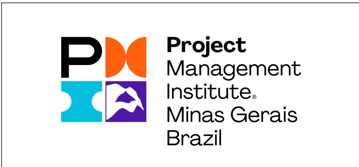
Figura 1. Exemplo de figura.

As figuras e os materiais gráficos podem ser em preto e branco ou coloridas e incluídas como parte integrante do texto. Cada figura deve ter um número e o título colocado abaixo da figura, centralizada, em Times New Roman 10 pt. e negrito. As figuras deverão ter bordas na cor preta com linha na espessura padrão do Microsoft Word.